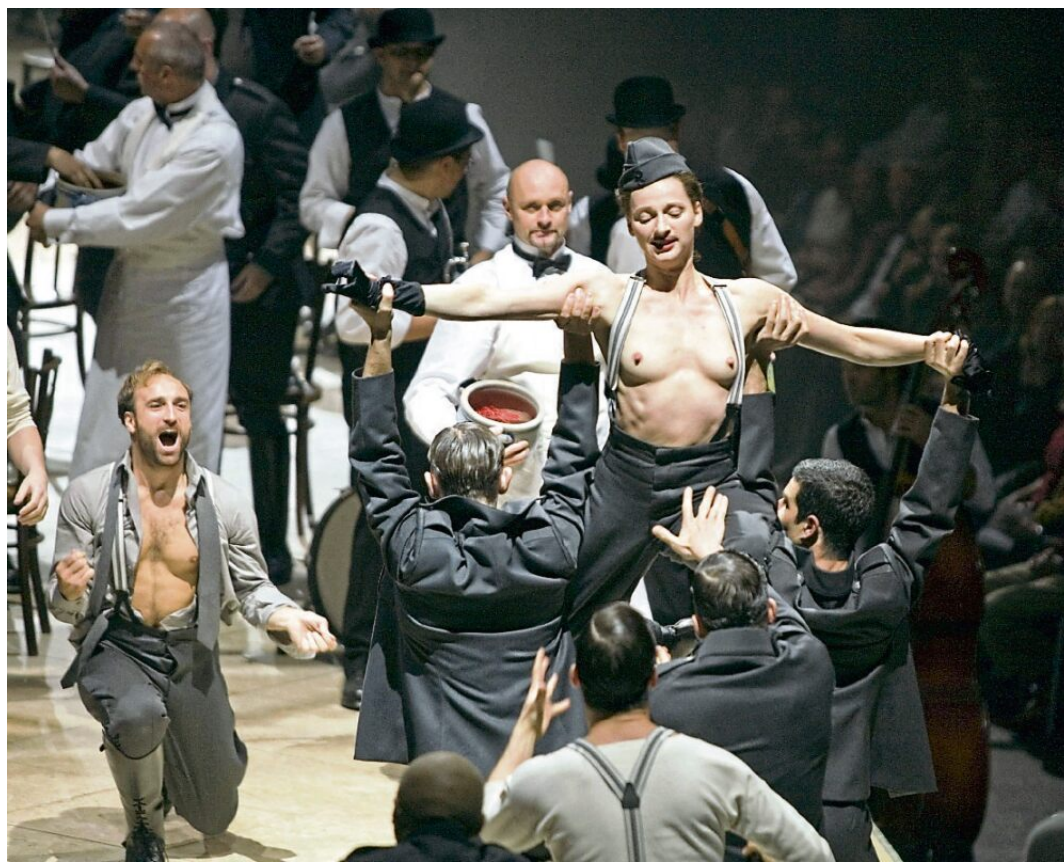
Szene aus der Oper „Die Soldaten“